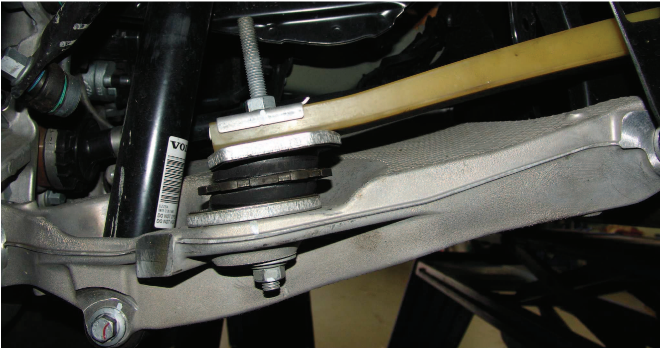
illustration 2: removing the spring pad left and right